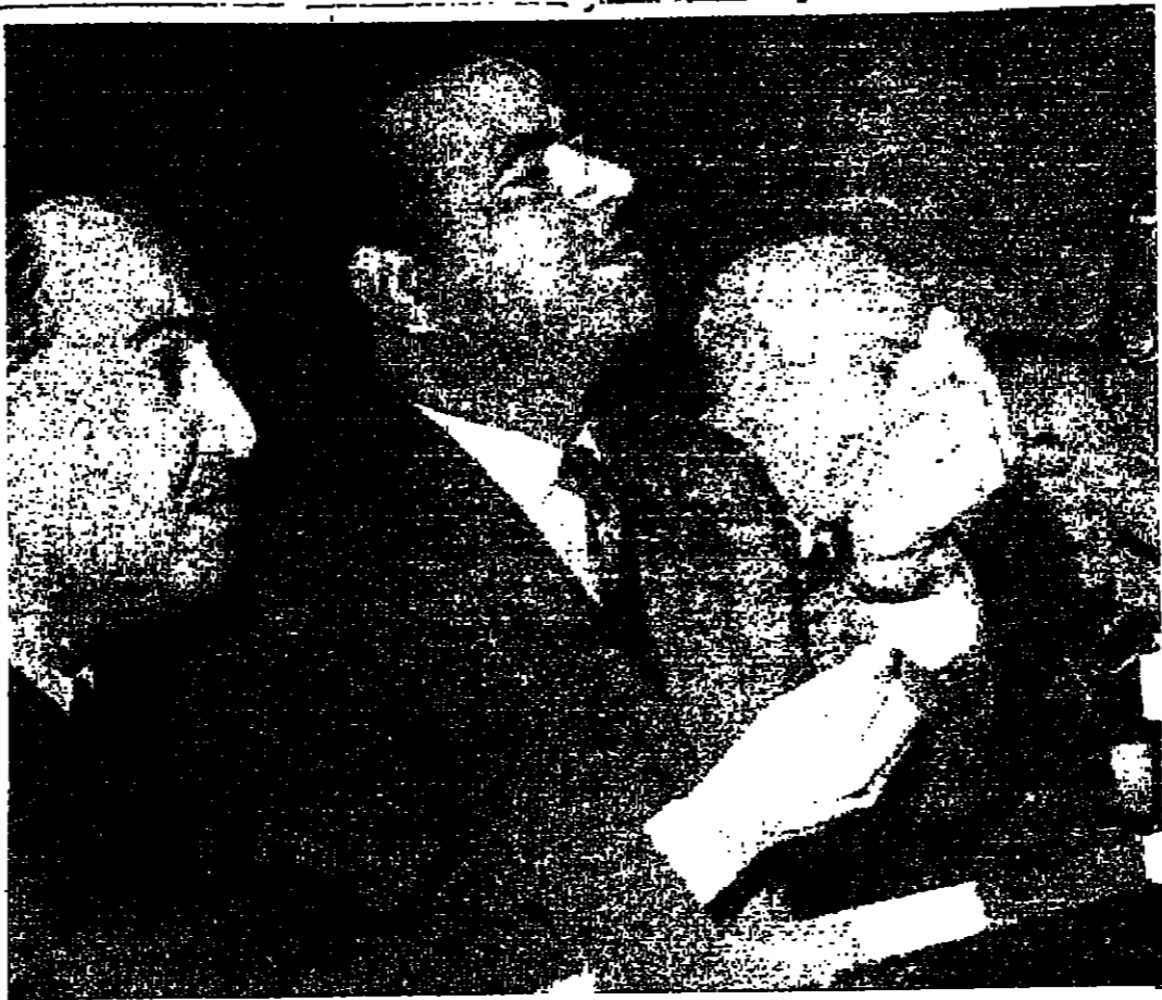
المرشد ابو ناري بيلي باقواله امام محكمة الثورة في القاهرة التي كشفتها عن قضية محاولة نكس طائسرة الرئيس جمال عبد الناصر والاهب الذي دفن قرب القاهرة (خاصة بالنسبة)

القاهرة - من مؤيد «السنور» - نظر أن عقد الجلسة الختامية لمؤتمر الصحفيين العرب في قاعة المؤتمرات بالجامعة العربية في الساعة السادسة من مساء اليوم - وقد بين التوصيات التي اجمع عليها أعضاء الوفود الإسراع في تنفيذ مشروع المطالبة الصحية الموحدة التي تصدر عن الإتحاد وجملة الصحفيين المترغون في سائر الدول العربية والتي تمنع لهم تسهيلات في الانتقال والعمل - ومن أهم التوصيات ونص كل محاولة لخدمة قضية فلسطين والأعباء بالصحافة العربية لأن تؤدي دورها المسؤول اعلامياً وتوجيهياً بما يؤيد هذا المشروع (مؤتمر صحفيين العرب في بيروت) إلى رجال المقاومة العرب الذين يعمرون عن ارادة الشعب الفلسطيني في استعادة وطنه واكتت ضرورة المحافظة على الكيان الفلسطيني وتوحيد كفاءات القوى الفلسطينية وتوصية الحكومات العربية بتبنيها طاقاتها وامكانياتها في خدمة موقف الصمود والاطلاق من ظروف التفتت اوجهه المحر ونصية جميع مظاهر التفوق الاجريالي في فلسطين والاراضي التي تعرضت لعمل العربي ام عسكرية ام سياسية - وقد انتهت لجان المؤتمر اعدادها لاسيما لجنة قضية فلسطين - الاستعداد العربي لفتح مشروع خطبة عمل فاشلة قضية فلسطين والمؤمنون والاسباب التي أدت إلى التفتت - ودراسة الظروف الاستعداد العربي وطبيعة العمل العربي القومي بمختلف مستوياته وعدم التهم الكامل للدور واهدائه وعدم الادراك الحقيقي لواقع القوى الدولية وموازنتها وموقف اسرائيل فيها -